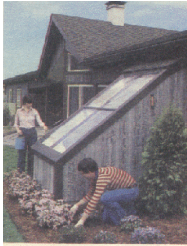
Figura 4- Caja colectora con varios vidrios